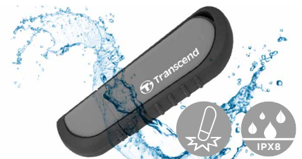
抗震防水，耐用度更上一層樓